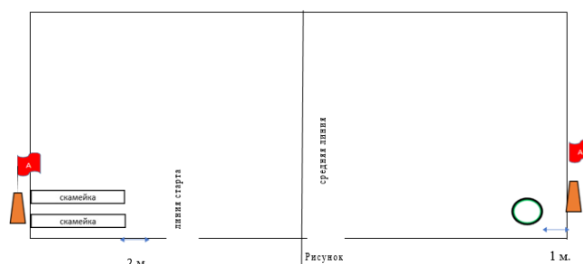
Схема расположения оборудования и участников представлена на рисунке 1.

Место команды определяется по наименьшей сумме времени всех шести эстафет.